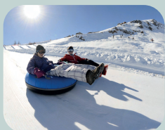
SKI DAY VALLE NEVADO