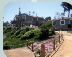
ISLA NEGRA + ALGARROBO + UNDURRAGA