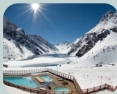
PORTILLO+ LAGUNA DEL INCA