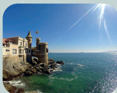
VIÑA DEL MAR E VALPARAÍSO