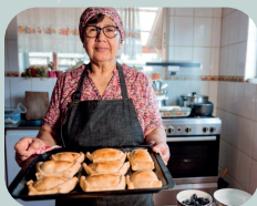
LA CASA CHILENA

Para ir à página do tour desejado, basta clicar acima dele.