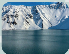
CAJON DEL MAIPO + SALTO EL YESO