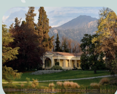
CONCHA Y TORO TRADICIONAL