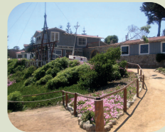
ISLA NEGRA + ALGARROBO + UNDURRAGA