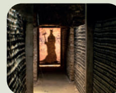
CONCHA Y TORO MARQUES