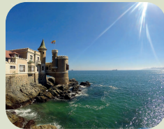
VIÑA DEL MAR E VALPARAÍSO