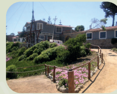
ISLA NEGRA + ALGARROBO + UNDURRAGA