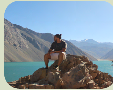
CAJON + EMBALSE + TERMAS DE COLINA