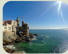
VIÑA DEL MAR E VALPARAÍSO