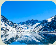
PORTILLO + LAGUNA DEL INCA