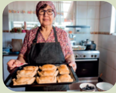
LA CASA CHILENA

Para ir à página do tour desejado, basta clicar acima dele.