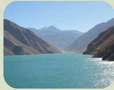
CAJON DEL MAIPO + EMBALSE EL YESO