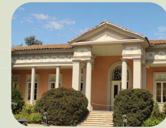
CONCHA Y TORO TRADICIONAL